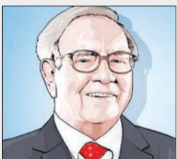
وارن بافت سهام ایل را جایگزین سهام IBM کرد