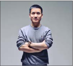
افشای قیمت گوشی وان پلاس 5T

۶ راهکار برای حفظ ارتباطات پایدار در فضای شراکت