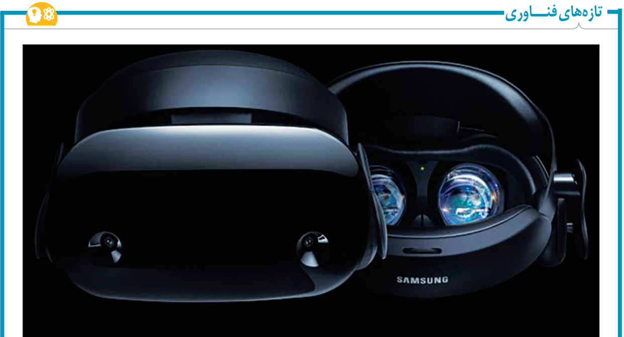
هدست واقعیت ترکیبی سامسونگ ادیسه معرفی شد.