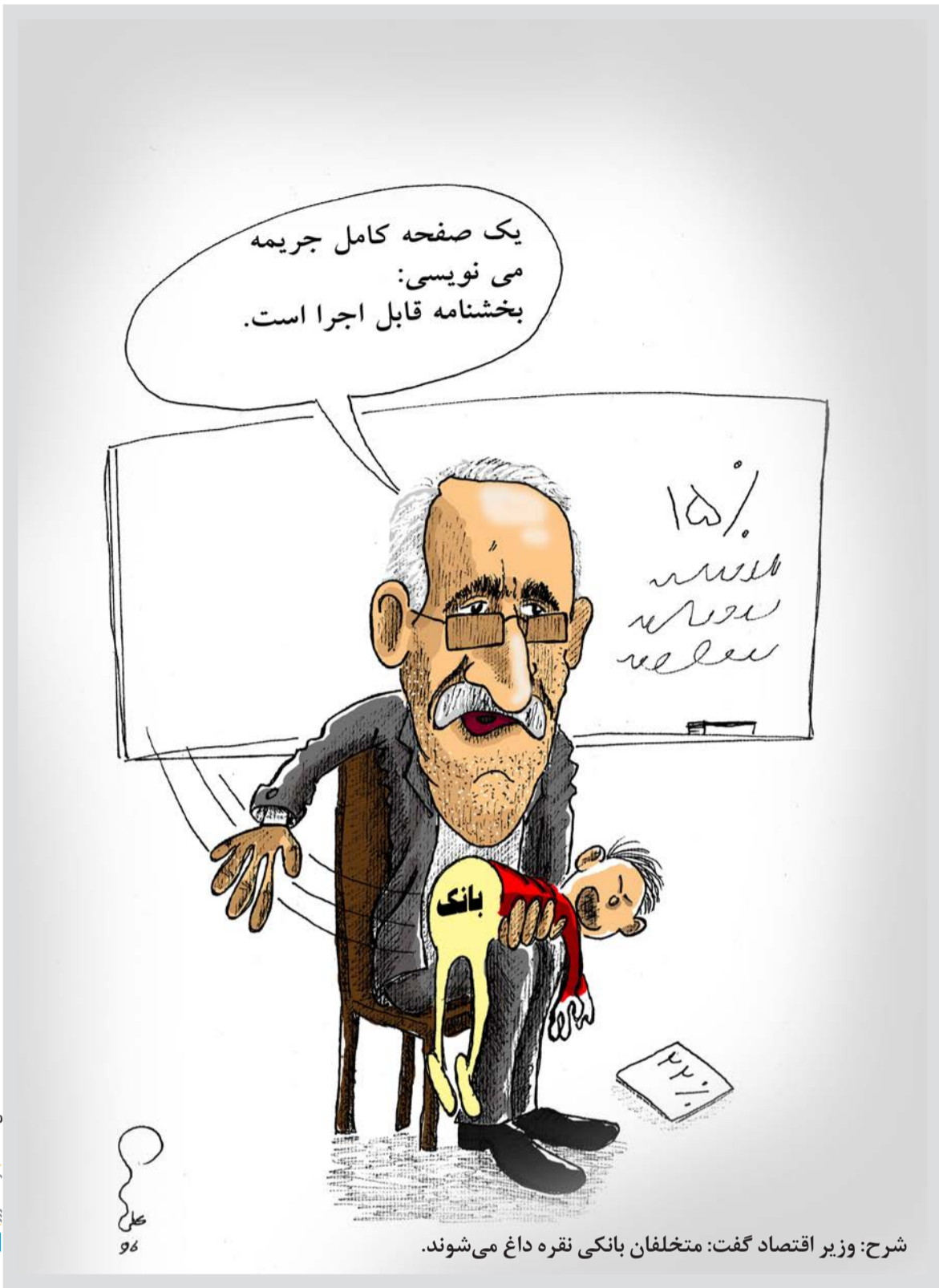
شرح: وزیر اقتصاد گفت: متخلفان بانکی نقره داغ می‌شوند.