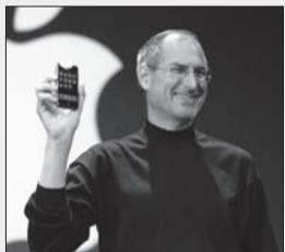
بزرگداشت یاد استیو جابز در ششمین سالروز درگذشت او