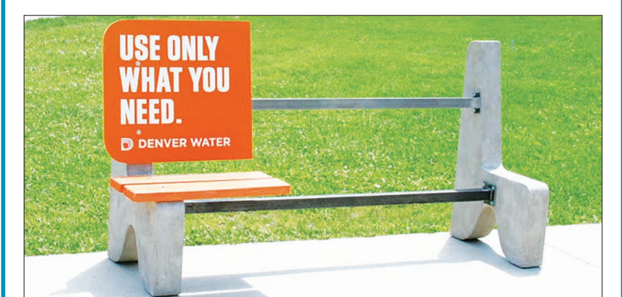
آگهی - شرکت آب و فاضلاب دنور شعار: به همان اندازه که نیاز دارید استفاده کنید.