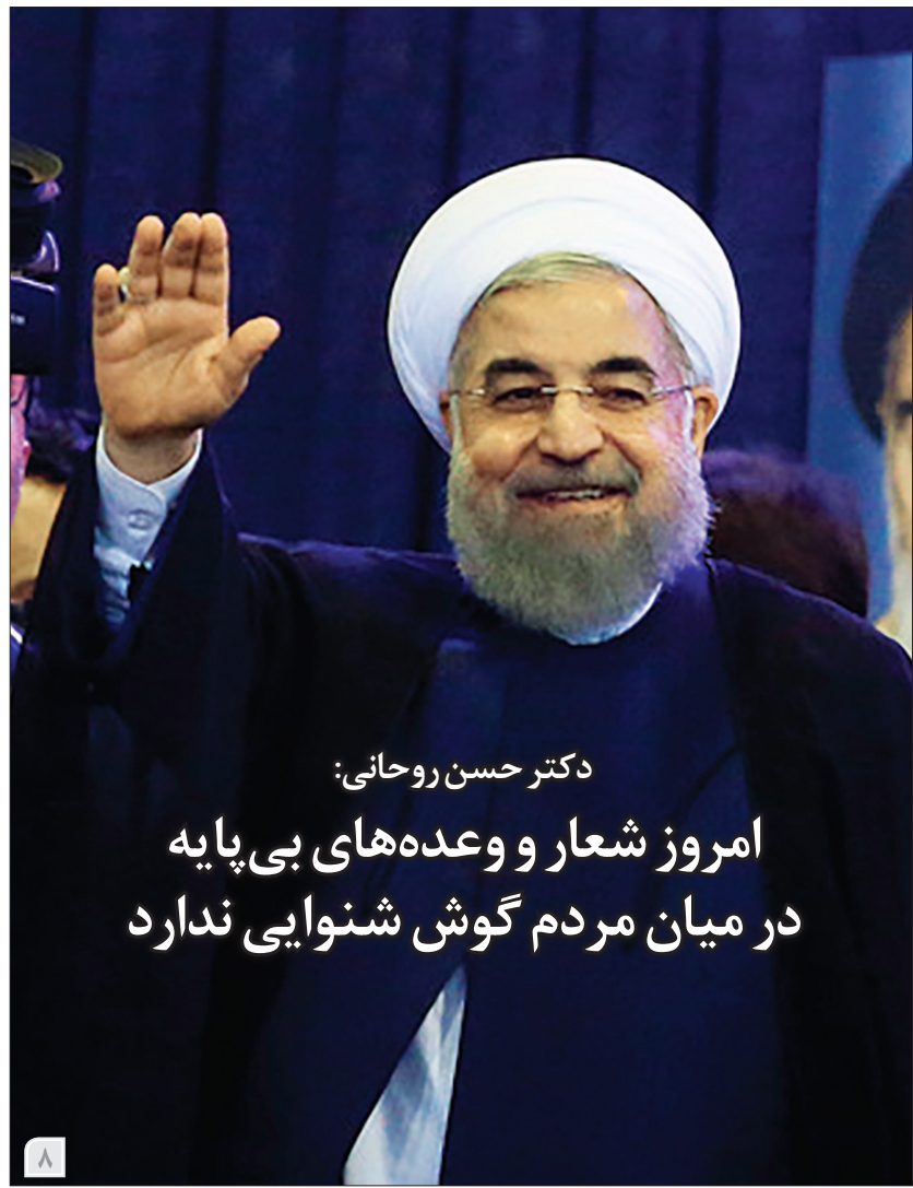
دکتر حسن روحانی: