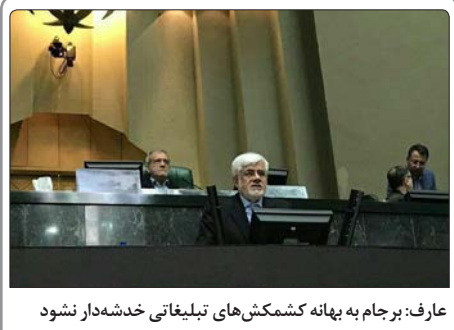
عارف: برجام به پناه کشمکش‌های تبلیغاتی خدشه‌دار نشود

عرصه بین‌المللی و منطقه‌ای منزوی کنند. یکی از نمودهای عینی گسترش روابط ایران و کشورهای اروپایی علاوه بر برگزاری گفت‌وگوهای منظم سیاسی بین ایران و اتحادیه اروپا و فعال شدن کمیسیون‌های مشترک ایران و برخی از کشورهای اروپایی که سال‌ها بود برگزار نمی‌شد و از توقف افتاده بود، رفت‌وآمد وزیران خارجه این کشورها به تهران پس از دستیابی ایران و ۵۰۱ به توافق اولیه ژنو و نیز بعد از آن است، چنانکه در چهار سال گذشته شاهد سفر وزیران خارجه کشورهای مطرح قاره مثل سبز فرانسه، انگلیس، ایتالیا، آلمان، اتریش و ... به تهران بوده‌ایم. براساس آمار اعلام شده تاکنون وزیران خارجه اروپایی ۵۴ بار به تهران سفر کرده‌اند و در مقابل محمدجواد ظریف نیز در پاسخ به دعوت هم‌تایان خود یا به منظور شرکت در اجلاس‌های بین‌المللی ۴۶ بار به کشورهای اروپایی سفر کرده است.