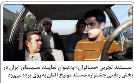
مستند تجربی «مسافران» به‌عنوان نماینده سینمای ایران در بخش رقابتی جشنواره مستند مونچ آلمان به روی بوم می‌رود.