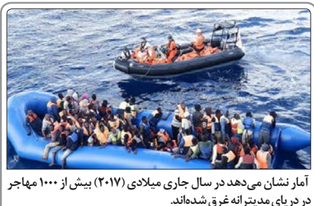
آمار نشان می‌دهد در سال جاری میلادی (۲۰۱۷) بیش از ۱۰۰۰ مهاجر در دریای مدیترانه غرق شده‌اند.