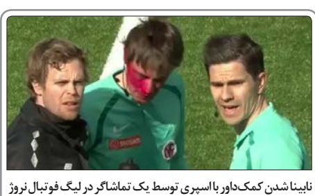
ناینبا شدن کمک‌داور باسپری توسط یک تماشاگر در لیگ فوتبال نروژ