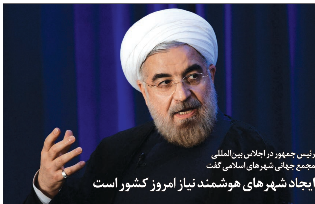
رئیس جمهور در اجلاس بین المللی مجمع جهانی شهرهای اسلامی گفت